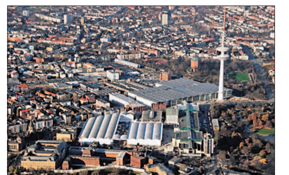
Die Messe Hamburg. Im hinteren Teil sind die neuen Hallen zu erkennen.