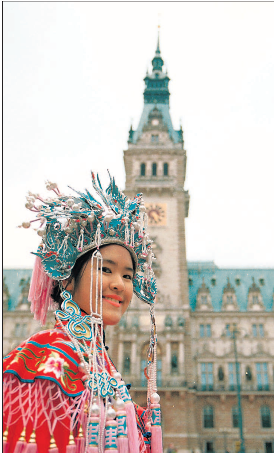
Eine Chinesin in traditioneller Kleidung zum chinesischen Neujahrsfest vor dem Hamburger Rathaus. 2008 fällt das Fest auf den 7. Februar.